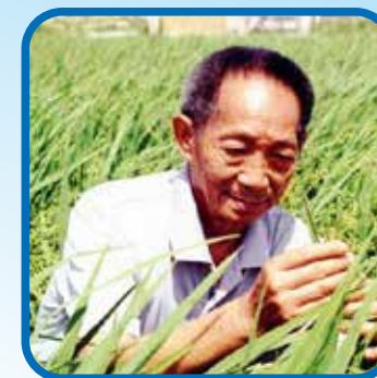
袁隆平 中国工程院院士

The chairman of the organizing committee