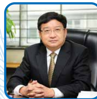
万建民 中国工程院院士

The vice-chairman of the organizing committee